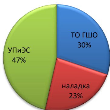
Структура доходов по направлениям за 2014 год