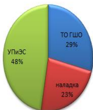
Структура доходов по направлениям 2015 год