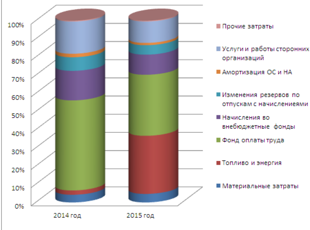
Структура затрат по статьям 2014-2015 г.г

Максимальный удельный вес в 2014 году приходился на элемент себестоимости «Фонд оплаты труда», В 2015 году - на долю ФОТ приходится менее 33%, а доля статьи «Топливо» увеличилась с 2% до 32%., таким образом, в структуре затрат 2015 году произошли значительные изменения.